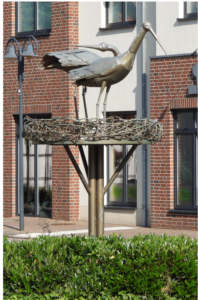
Der „Storchenzirkel“ in der Petershäger Innenstadt: Der Storch im Zentrum des Geschehens, Foto: Sigrid Janetzko.

Auch im öffentlichen Bild der Stadt Petershagen ist der Storch stark vertreten. Seit 2007 trägt sie den Storch und seinen grünen Lebensraum in ihrem Logo und nennt sich stolz „Storchenhauptstadt Nordrhein-Westfalen“.