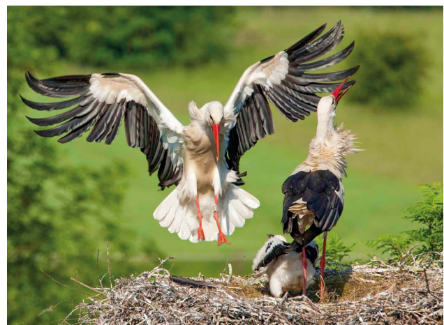
Brutpaar auf dem seit 1933 bestehenden Horst Jössen I auf einer Esche des Hofes Humke, Foto: Lothar Meckling.

Im einst storchenreichen Bundesland Nordrhein-Westfalen überdauerten nur noch drei Horststandorte in der Petershäger Weseraue. Regelmäßige winterliche Hochwasser und schließlich die Ausweisung von wesernahen Naturschutzgebieten schützten ihren restlichen verbliebenen Lebensraum vor intensiver landwirtschaftlicher Nutzung sowie Bebauung. Zwischen 1948 und 1994 konnte sich der Storch in Nordrhein-Westfalen lediglich im Kreis Minden-Lübbecke halten, von 1987 bis 1992 nur noch in den drei Petershäger Weserdörfern Jössen, Windheim (alternierend mit Döhren) und Schlüsselburg. Schien das Aus schon vorprogrammiert, berichteten die Medien alljährlich wie überschwänglich aus dem „Storchenparadies Jössen“, wo sich ein Brutpaar auf der 1933 erstmals besetzten Esche des Hofes Humke halten können.