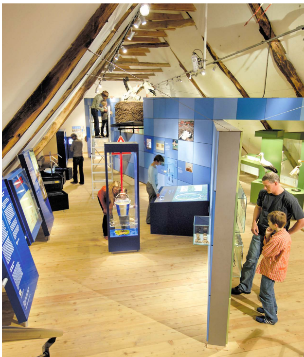
Blick in das Westfälische Storchenseum auf dem großen Dachboden, Foto: Peter Hübbe.

Windheim № 2 wurde sogar zu einem Star im WDR-Fernsehen. Der inzwischen gegründete Verein „denkmal! Windheim № 2“ konnte mit Eigenmitteln, großzügigen Spenden, Denkmalförderung und Unterstützung durch die Stadt an die Arbeit gehen. Die größte und entscheidende Unterstützung kam dann von der Nordrhein-Westfalen-Stiftung „Natur.Heimat.Kultur“, die die Restaurierung förderte und schließlich auch dem „Aktionskomitee Weißstörche im Kreis Minden-Lübbecke“ die Einrichtung des Westfälischen Storchenseums auf dem großen Dachboden ermöglichte. Heute ist das Haus, dessen Trägerverein sich den Untertitel „Interessengemeinschaft für Bauwerkerhalt, Umwelt- und Kulturpflege“ gab, als ein Kulturzentrum für die Zukunft gesichert. Weit über die Stadt- und Kreisgrenzen hinaus ist es als herausragendes Denkmal, Zentrum der Petershäger Störche mit dem Museum, stark