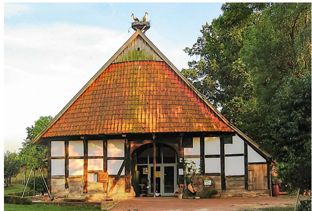
Von der Hofstätte her ist die Dreiständer-Konstruktion gut erkennbar. Niedrige Abseite nach Westen. Das Hoftor steht nicht mittig, Foto: Brunbild Wagner.

Auch nach der Brandkatastrophe erlebte № 2 wirtschaftlich gute Zeiten, bevor dann jedoch ein langsamer wirtschaftlicher Niedergang mit dem Verkauf wesentlicher Flächen der Stätte eintrat.