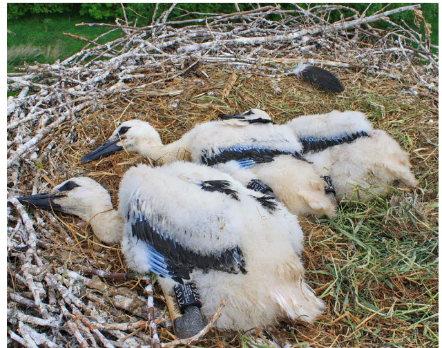
Über Jahrzehnte lieferte die Beringung der Jungstörche im Alter von drei bis sechs Wochen die Daten, die halfen, das Leben der Petershäger Störche zu verstehen, Foto: Alfons R. Bense.

Die im Gebiet der Stadt und des Kreises aufwachsenden Jungstörche wurden über Jahrzehnte konsequent beringt.