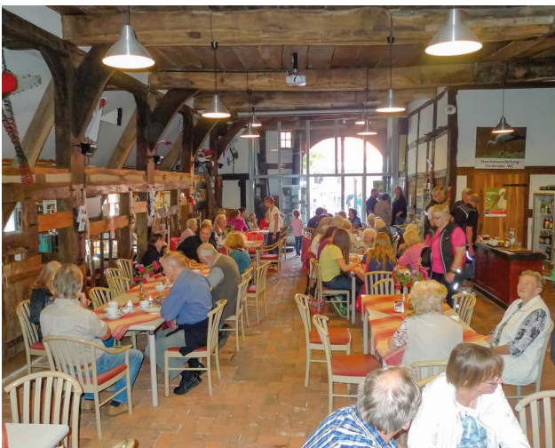
Blick in die breite Diele des Hauses Windheim № 2 mit dem Café № 2, Foto: Alfons R. Bense.

Könnte ein Haus sprechen, dieses hätte Vieles zu erzählen, wahrhaft Dramatisches. Die Geschichte des Hofes № 2 im Weserdorf Windheim reicht nachweislich bis ins Mittelalter zurück. Er stand noch neben der № 1, dem heutigen Platz des Hauses Curia der evangelischen Kirche. Eine große Feuersbrunst hatte im Jahr 1700 das Dorf mit seinen vielen strohgedeckten Fachwerkhäusern ergriffen, 43 Gebäude brannten nieder, auch die Hofstätte № 2. Bereits 1701 konnte der damalige Eigentümer außerhalb des Ortskerns „Vor dem Ostertore“ seine Wohn- und Betriebsstätte neu errichten. Die Nummerierung № 2 nahm er mit, denn Straßen waren noch nicht benannt und die Gebäude zunächst gemäß ihrer wirtschaftlichen Stärke durchnummeriert worden. Gebaut wurde modern und großzügig. Ein Dreiständer-Fachwerkhaus mit angegliedertem Kammerfach findet sich im westfälischen Raum nur im Zeitfenster von circa 1650 bis 1750 als Übergang von der Zwei- zur Vierständerkonstruktion errichtet. Die Diele mit einer Breite von 8,10 Metern benötigte mächtige Eichenbalken, in den Luchten mit einer Stärke bis zu 65 Zentimetern.