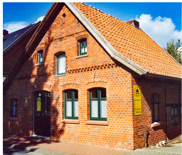
„Dat lüttke Hues“, Gästehaus des Trägervereins, Foto: Alfons R. Bense.

Das Café № 2 auf der großen Diele und mit attraktivem Biergarten ermöglicht Ruhe und Entspannung. Mit seinem eigenen Stil und Angebot sowie zahlreichen Veranstaltungen lockt es viele Besucher ins Weserdorf Windheim.