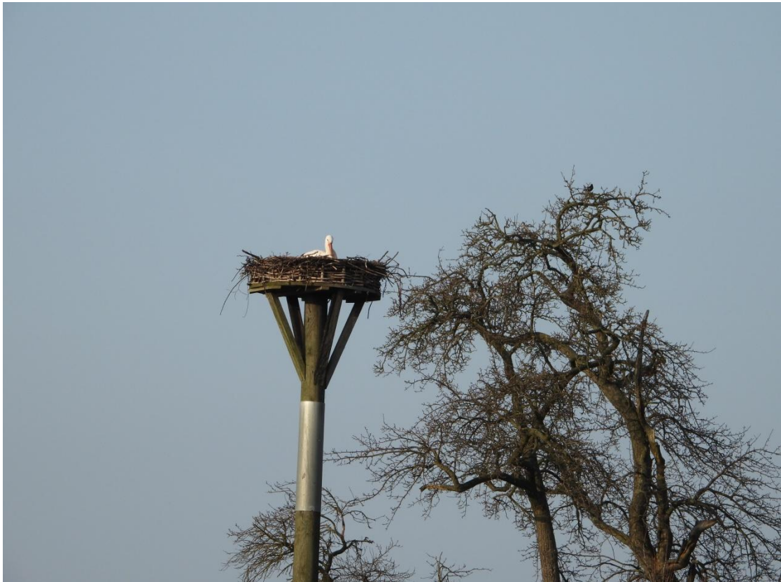
Ein Storch auf dem Horst Nettelstedt V auf dem Hof Gerdom an der Horster Straße.