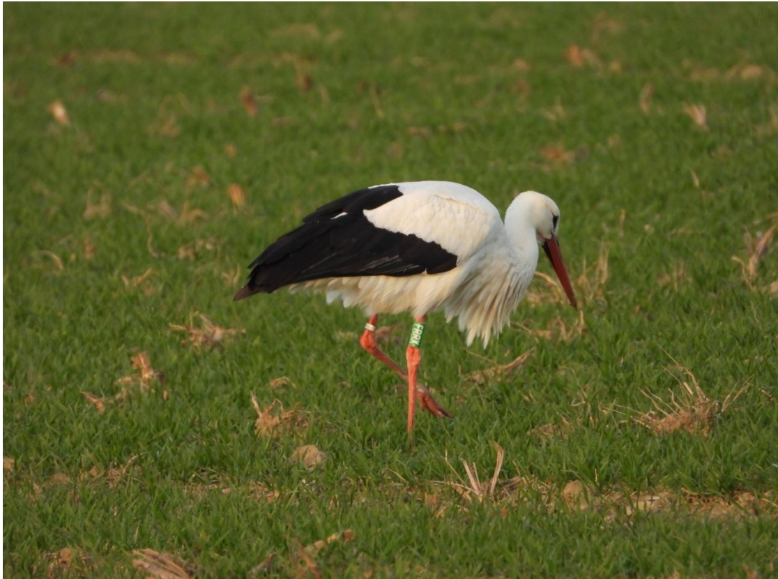
Das Männchen FRP CK16288 (FRRX grün) in Lübbecke-Nettelstedt.