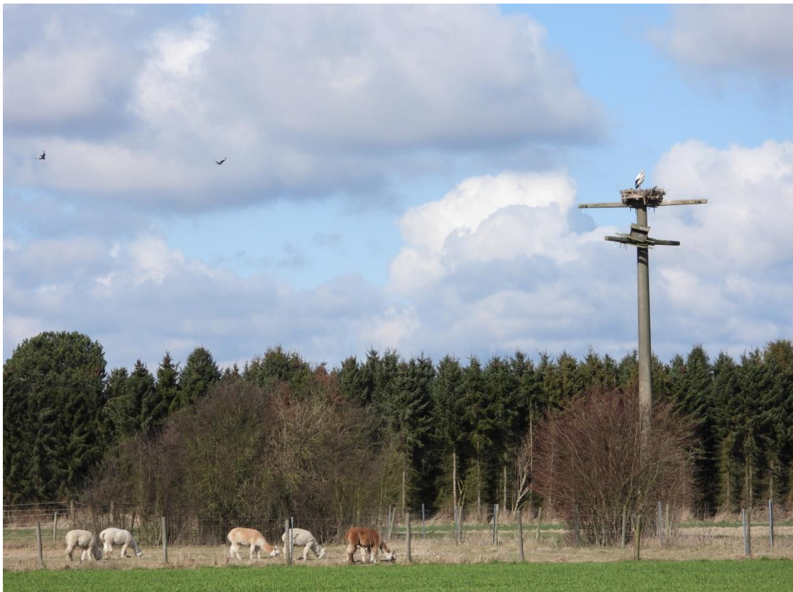
Das Männchen FRP CK16288 (FRRX grün) auf seinem diesjährigen Domizil, dem Horst Nettelstedt III auf dem Betonmast im Ortsteil Husen.