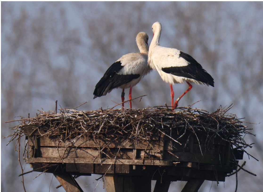
Das Storchenpaar auf dem Horst Gehlenbeck IV am Moorhus des Nabu am 9. März. Rechts das Männchen Helgoland E4808 (rechts unten) und links das Weibchen DEW 3V750 (links oben).