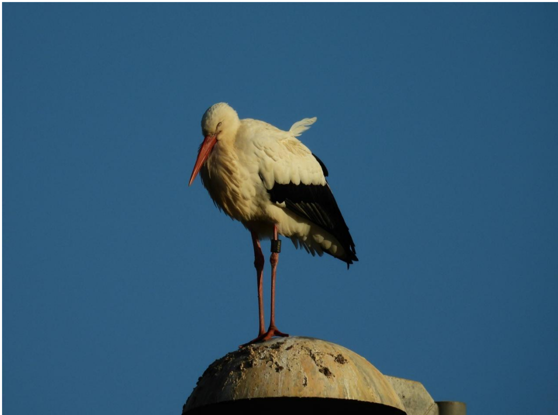
Am 20. Dezember 2024 stand DEW 1X377 (links oben) mittags auf einer Laterne inmitten eines Kreisels am Ortsrand von Büttelborn unbeeindruckt vom Geschehen und döste vor sich hin.