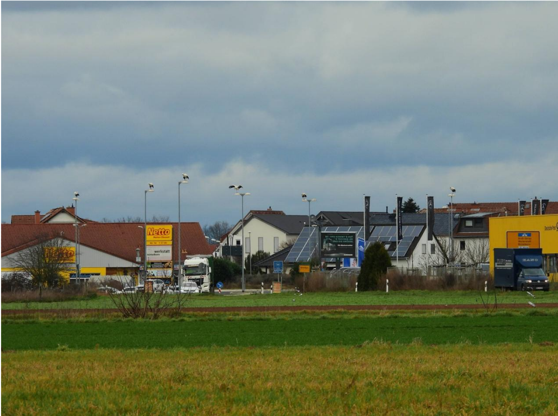
Der besagte Kreisel am Ortsrand von Büttelborn am 17. Dezember. Auf fast jeder Straßenlaterne stand ein Storch. Vielleicht war einer der Störche DEW 2T636 (links oben). Am 4. Januar wurden nur rund 120 Störche gesichtet, darunter auch DEW 2T636 (links oben).