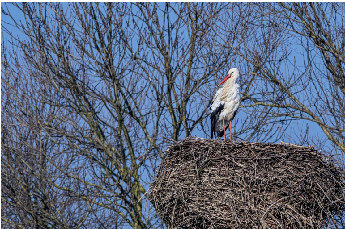
Unberingter Storch am 8. Februar auf dem Horst Rothenuffeln I im Ritterbruch. Wenn nicht noch zu einem Wechsel kommt, wäre es ein neuer Storch, denn beide Brutvögel der anderen Jahre waren beringt.

Reihenfolge gemäß eingegangener Meldungen