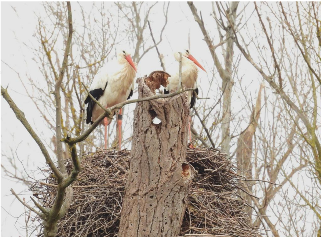
Nicht nur bei uns, sondern auch in der Ferne tingelt DEW 2T636 (links oben) ganz gerne mal vor der Brut von Horst zu Horst und besucht dabei auch andere Storchendamen. Hier am 28. Januar mit dem Weibchen DEW 9X919 (links oben) auf deren Horst. Ihr Partner war am 28. Januar noch nicht wieder zurück.